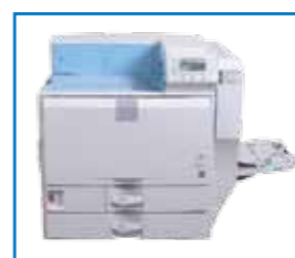
STANDARD 2 bacs x 550 pages + 100 pages par le bac multifonction