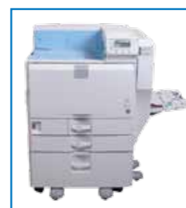
OPTIONNEL 2 bacs x 550 pages + 100 pages par le bac multifonction + bac haute capacité jusqu'à 2000 pages