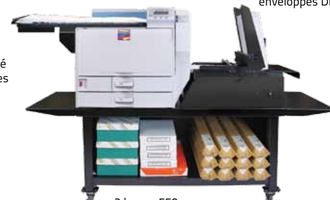
2 bacs x 550 pages + 100 pages par le bac multifonction + Margeur à chargement par le haut + convoyeur + stand