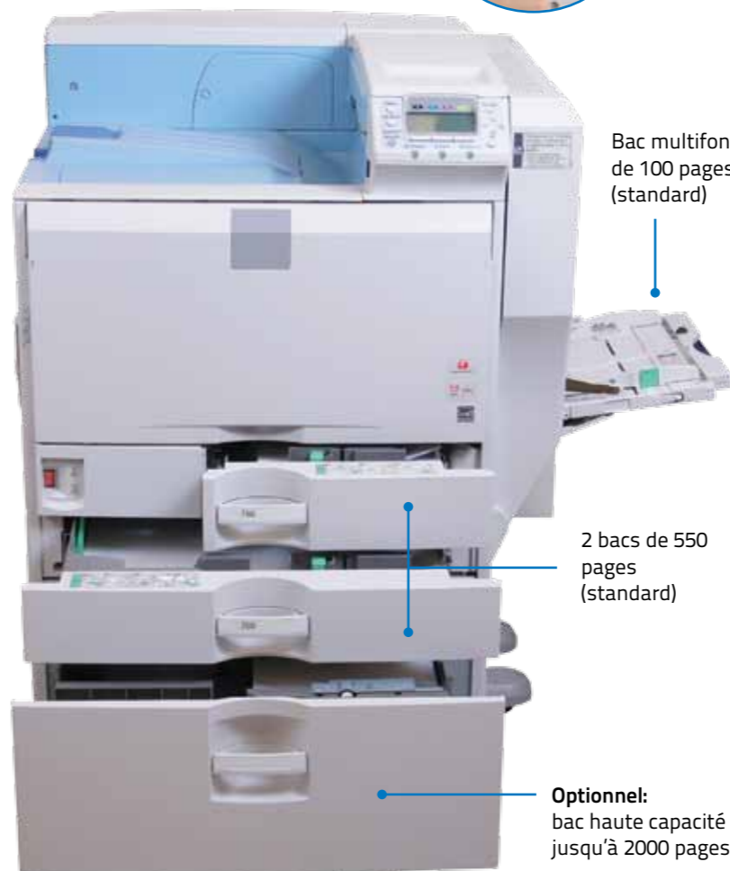
Bac multifonction de 100 pages (standard)