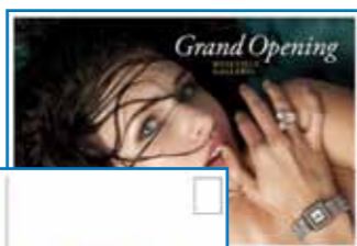
Données variables pleine vitesse