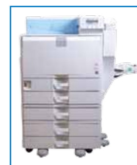
OPTIONNEL 5 bacs x 550 pages + 100 pages par le bac multifonction